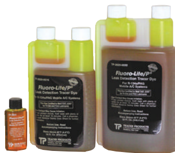
134a/PAGオイル向け TP-3820-0601 (28ml) TP-3820-0016 (500ml) TP-3820-0032 (1l)